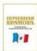
Почетная грамота Губернатора Новгородской области