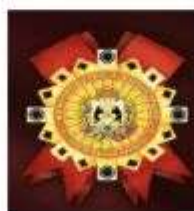
Почетный знак Новгородской области «За благотворительность и мecenатство»