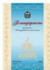
Благодарность Председателя Новгородской областной Думы