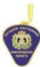
Знак Новгородской области «Лучший наставник»