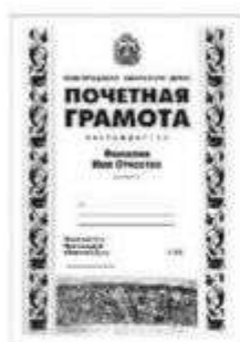
Почетная грамота Новгородской областной Думы