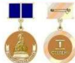
Медаль «Новгородская Слава» I, II степени